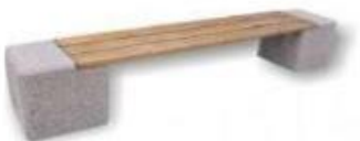
Nr. 4 Poilsiautojų suoliukai 15 vnt.