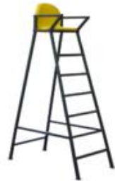
Nr. 3 Teisėjo bokštelis su sėdyne