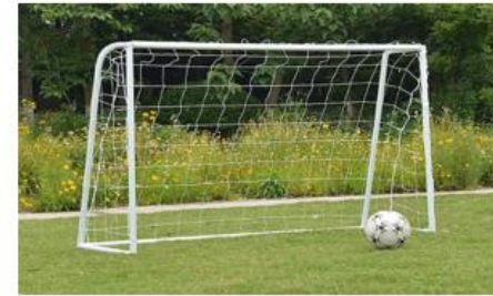
Nr.9 Futbolo vartai su tinklu ir kamuoliu (2 vnt)