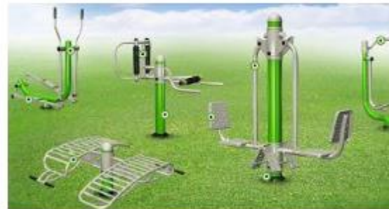
Nr. 7 Sporto treniruoklių kompleksas