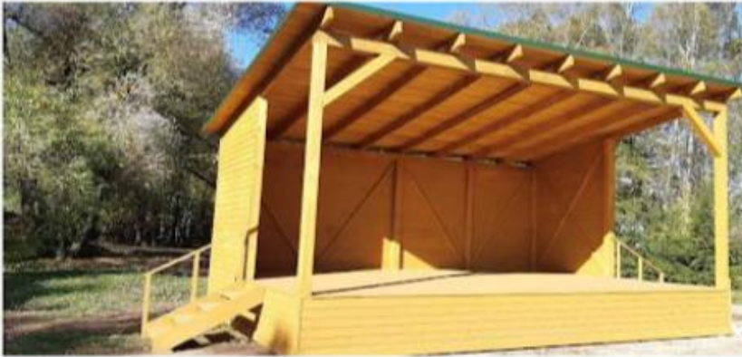
Nr. 1 Scena