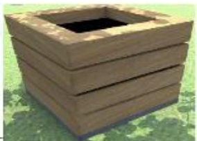
Nr. 5 Šiukšlinės 5 vnt.