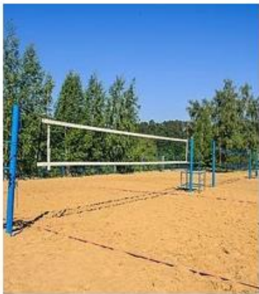
Nr. 2 Paplūdimio tinklinio stovas su tinklu