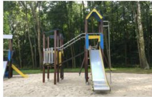
Nr. 6 Vaikų žaidimų aikštelė su supynėmis (lizdu)