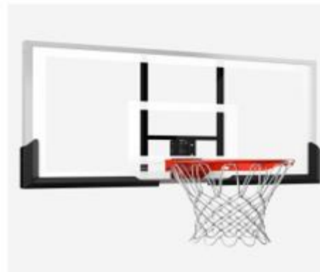
Nr. 8 Krepšinio lenta su lanku, tinkleliu ir krepšinio kamuoliu