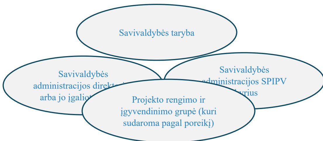
3 pav. Lazdijų rajono savivaldybės administracijos projektų valdymo organizacinė struktūra